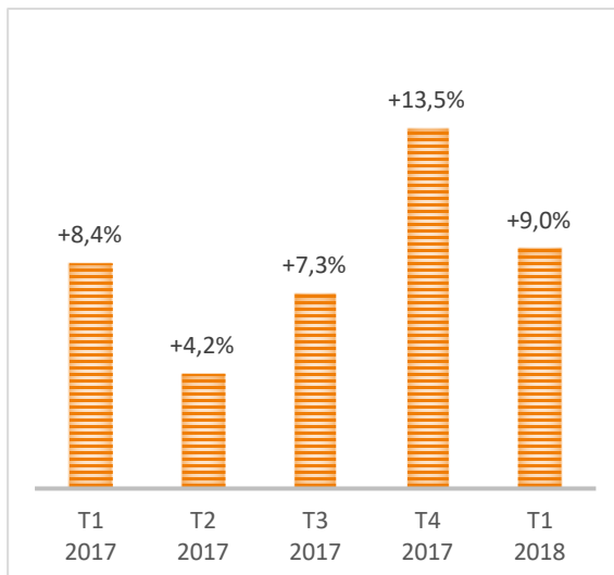
Graphique 1 - Production* trimestrielle (variation annuelle)