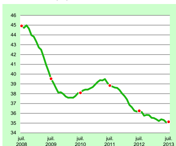
Production en année mobile au cours des dernières années* (juillet 2008 à juillet 2013) Graphique 2 – En milliards d'euros

* Toutes opérations confondues. Données mensuelles cumulées sur douze mois.