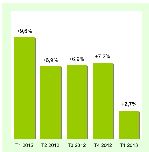
Variation annuelle de la production (%)*